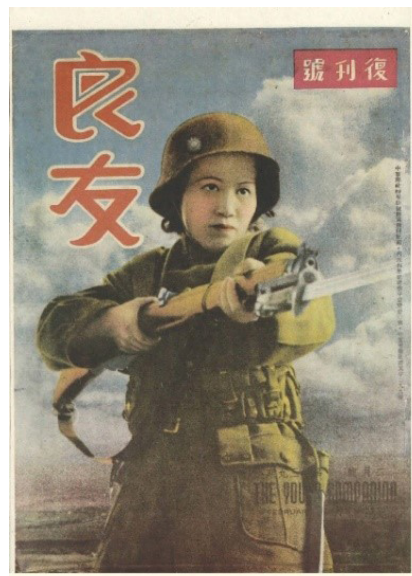
Figura 2. Mujer soldado