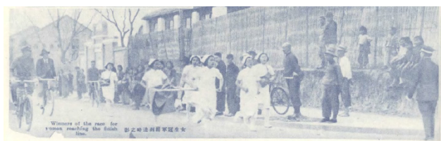
Figura 12. Las mujeres estudiantes en la Carrera disfrazadas de enfermeras