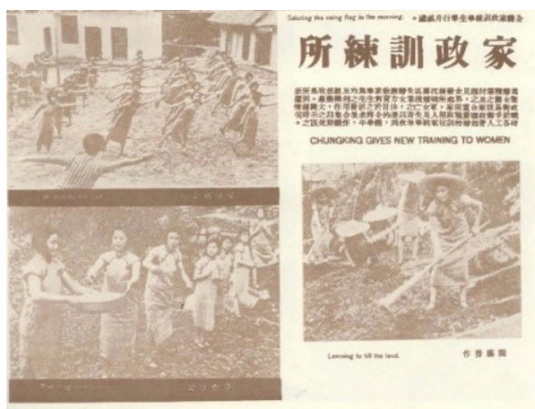
Figura 13. Mujeres en formación profesional