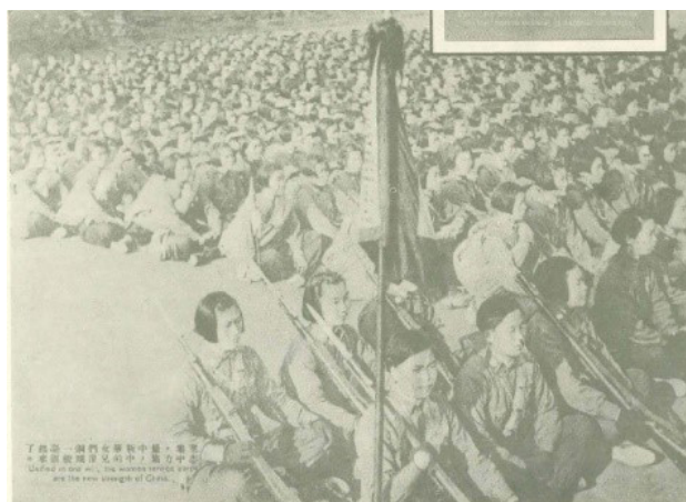
Figura 9 Mujeres armadas en la unión militar

Zelandia. Xia xiaoxia fue la única fotógrafa corresponsal de guerra quien tenía trabajos publicados en 'Liang You' donde elogiaba el papel estrella de las mujeres chinas en la guerra (Xia, 1939: 29). De todas maneras, es difícil localizar los artículos escritos por las mujeres corresponsales en 'Liang You' por falta de firmas.