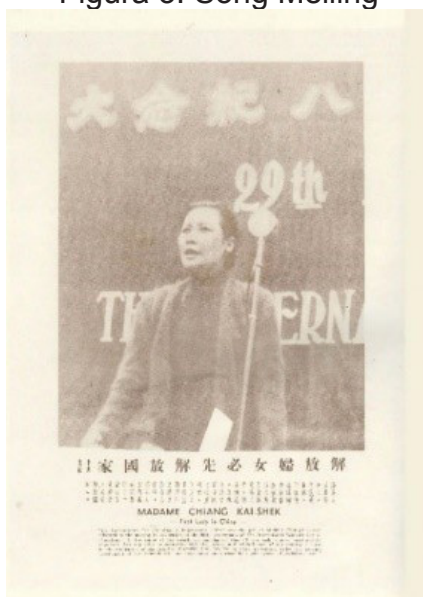
Figura 3. Song Meiling

Song se preocupaba por la situación del niño fundando varias guarderías infantiles en el territorio chino (Imágenes variables de mujeres en la era moderna, 1938: 27), y se confiaba en la fuerza femenina en la defensa nacional donando dinero en Chongqing para apoyar la unión de la mujer (Zhuo, 1939: 4). Expuso discursos en radio internacional para llamar atención de la mujer americana sobre los hechos crueles realizados por japoneses en China (Zhuo, 1938: 17). Incluso, vinculó la libertad de la mujer con la independencia del país. En el Día Internacional de la Mujer de 1939, lanzó un discurso que se destinaba para aumentar la participación de la mujer a la guerra: "si queremos liberar a la mujer, tenemos que salvar primero al país" (Figura 3) (Agencia Zhongyang, 1939: 5).