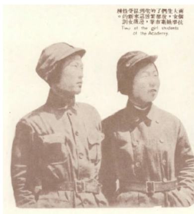
Figura 10. Las universitarias en Yan'an