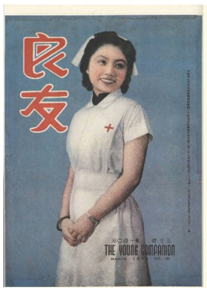
Figura 1. Enfermera