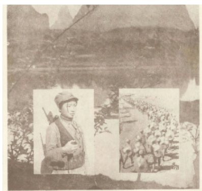
Figura 11. mujeres soldado-estudiantiles en su marcha a la guerra

Fuente: Muertos después del incidente del Puente de Marco Polo, 1938, p28